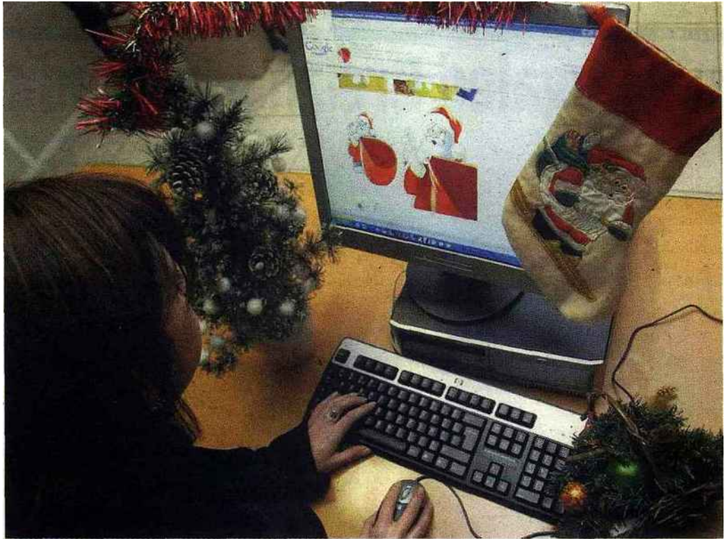
Sur Internet, il existe des boutiques éphémères spécialisées dans les cadeaux de Noël.

Pour s'y retrouver dans la manne des cadeaux possibles, les guides peuvent être de sacrés alliés. Dans les Fnac, on trouve ainsi des livrets de conseils pour choisir ses coffrets-cadeaux grâce à un tableau qui compare les prestations offertes — massage, nuit d'hôtel —, leur prix mais aussi la disponibilité car ces coffrets ont une date limite d'utilisation qu'il ne faut pas loupier. D'autres guides peuvent être précieux : pour éviter d'acheter des jouets toxiques, rendez-vous sur Projetnesting.fr , un recueil établi par l'association écologique WECE. Pour acheter écolo pour les grands ou les petits, du sapin jusqu'au rond de serviette, rendez-vous sur Mescoursespourlaplanete.com qui édite un guide avec l'Ademe (Agence de l'environnement et de la maîtrise de l'énergie).