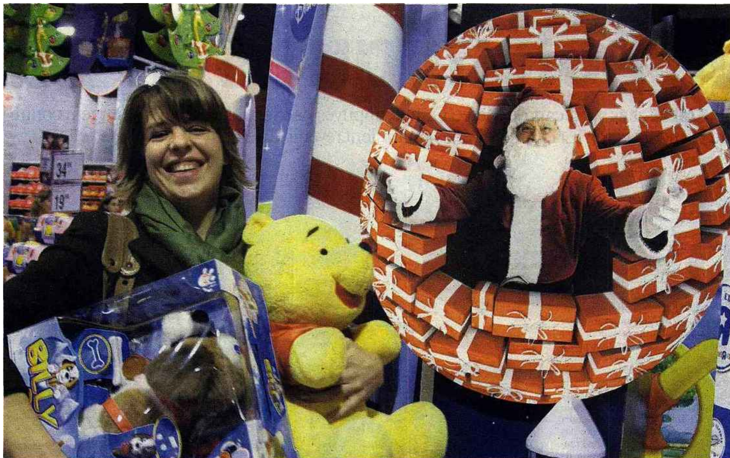
CENTRE COMMERCIAL DES QUATRE-TEMPS À LA DÉFENSE (HAUTS-DE-SEINE), HIER. Les parents achètent les derniers jouets à mettre sous le sapin. (LP/DELPHINE GOLDSZTEIN.)